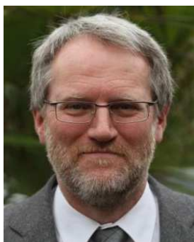
gezeichnet Christian Witt Kassenwart